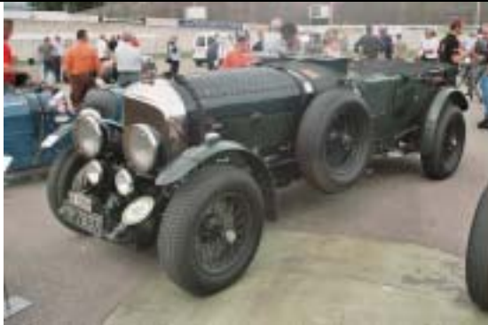
Bentley Le Mans, 1926, 7983 ccm, 200 PS