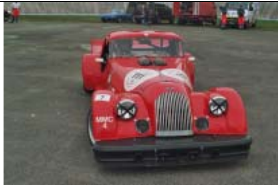
Morgan PUS 8 MMCA, 1979, 3500 ccm, 300 PS