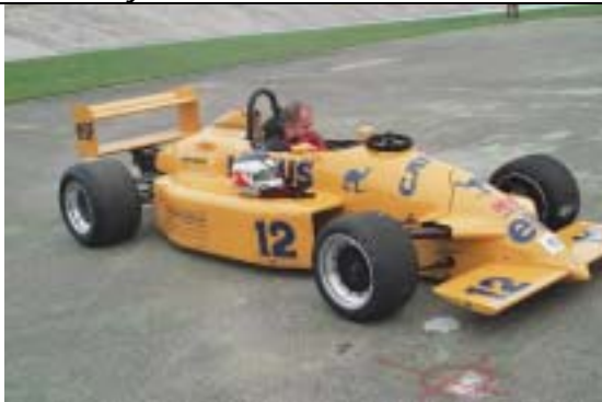
Opel Lotus, 1992, 2000 ccm, 200 PS