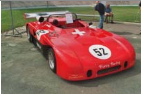
Sauber C5, 1976, 1998 ccm, 300 PS