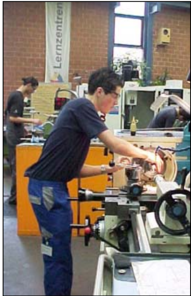
Fonduegabel zu zeichnen und zu fertigen.

Einige Lernende meldeten sich sofort und so entstand eine Gruppe aus zwei Konstrukteuren und drei Polymechnikern. Anfangs waren wir uns sehr unschlüssig, was wir fertigen wollten. Doch durch eine Ideensammlung kamen wir schlussendlich doch noch auf ein Ergebnis. Schlussendlich kamen wir auf die Idee, eine elektrische