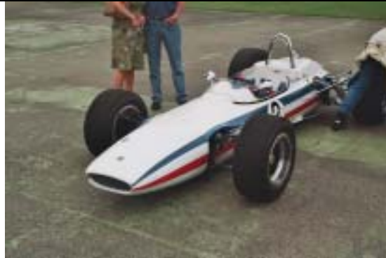
Lotus 32 F1, 1964, 1500 ccm, 190 PS