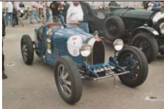
Bugatti 37 A, 1926, 1500ccm, 90 PS