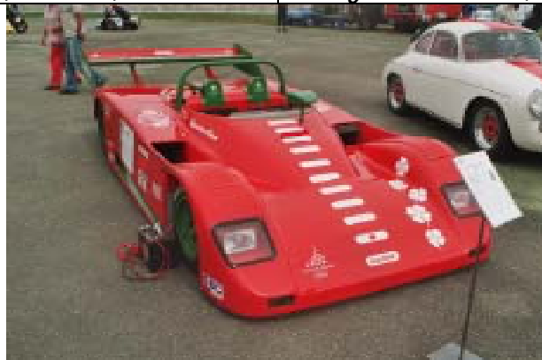
Alfa Romeo Lucchini CN, 1989